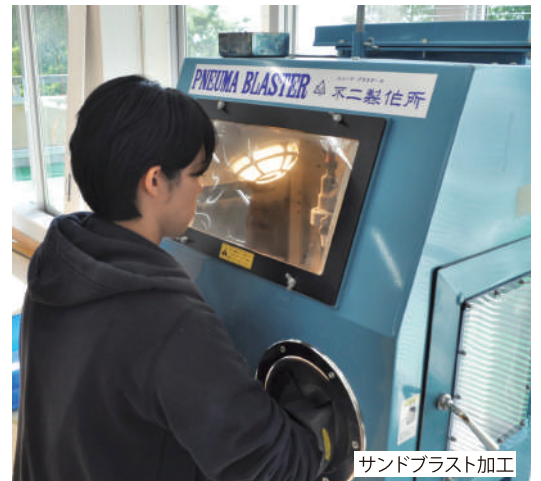
サンドブラスト加工

シールを貼ったコップ・皿と貸出道具類を引き取り、当館でスタッフがサンドブラスト加工を行います。