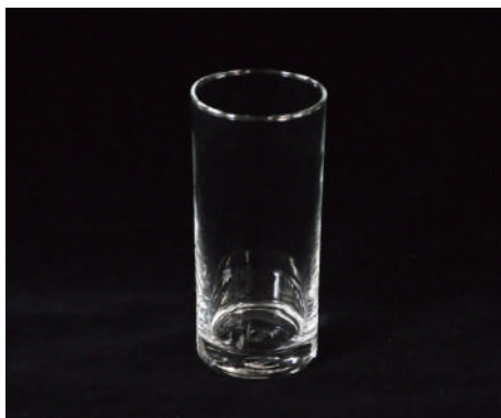
コップ① サイズ：H143×W65mm 容量：380ml