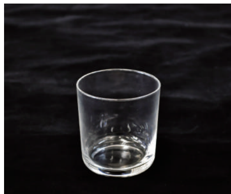
コップ③ サイズ：H79×W74mm 容量：245ml