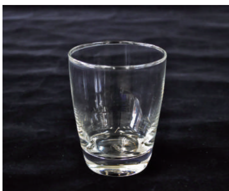
コップ④ サイズ：H107×W85mm 容量：365ml