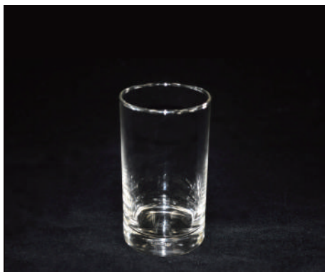
コップ② サイズ：H109×W63mm 容量：245ml